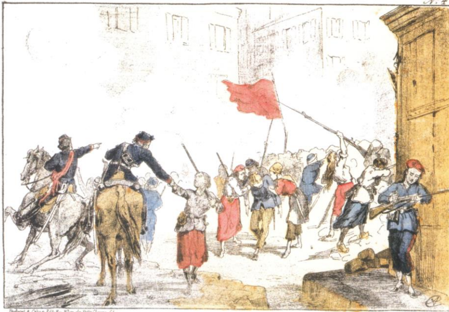
La barricade de la place Blanche défendue par des Femmes.

Elle trouve un emploi au journal L'Intransigeant et poursuit la lutte pour la condition féminine.