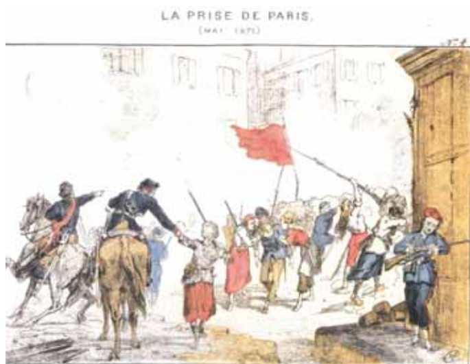
LA PRISE DE PARIS. (MAY 1871) La livraison de la plus blanche démission par des femmes.

Le peuple au collier de misère Sera-t-il donc toujours rivé ? Jusques à quand les gens de guerre Tiendront-ils le haut du pavé ? Jusques à quand la Sainte Clique Nous croira-t-elle un vil bétail ? À quand enfin la République De la Justice et du Travail ?