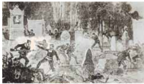
Les combats au Père Lachaise