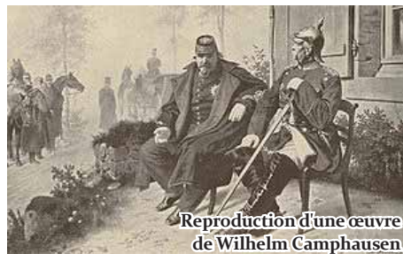
Le 2 septembre 1870, Napoléon III et Bismarck à Donchery. Entrevue après la bataille de Sedan.

Loin de renforcer le régime, celle-ci précipite son effondrement (capitulation de Napoléon III à Sedan le 2 sept. 1870) provoqué par une nouvelle irruption des travailleurs et du peuple sur la scène politique. (4 sept. 1870)