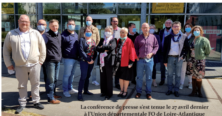
La conférence de presse s'est tenue le 27 avril dernier à l'Union départementale FO de Loire-Atlantique

Les personnels pourront toujours compter sur la disponibilité des syndicats FO. Et si le ministre Véran ne répond pas aux revendications, alors la question d'une montée au ministère se posera à nouveau. Nous ne lâcherons rien.