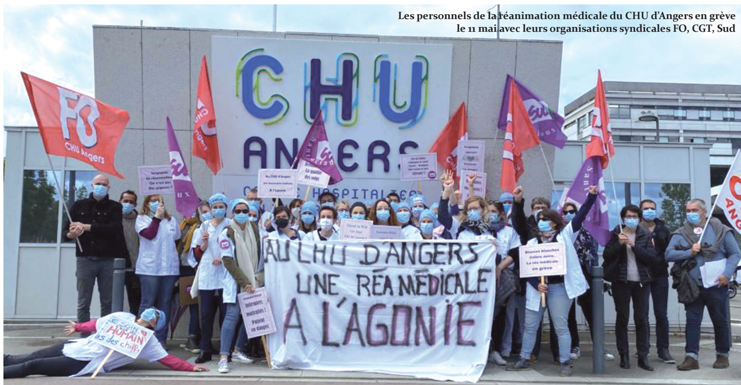
Les personnels de la réanimation médicale du CHU d'Angers en grève le 11 mai avec leurs organisations syndicales FO, CGT, Sud